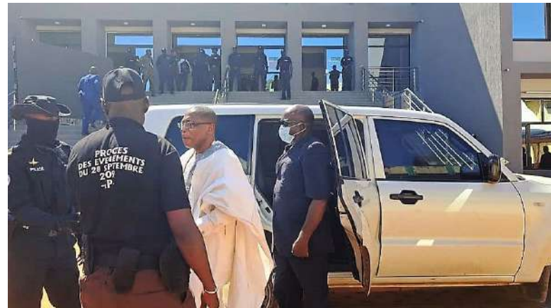
Bývalý guinejský prezident Moussa Dadid Camara na cestě k soudu [2]

O tom, jak proces dopadl, Vás budeme informovat v nadcházejícím Bulletinu.