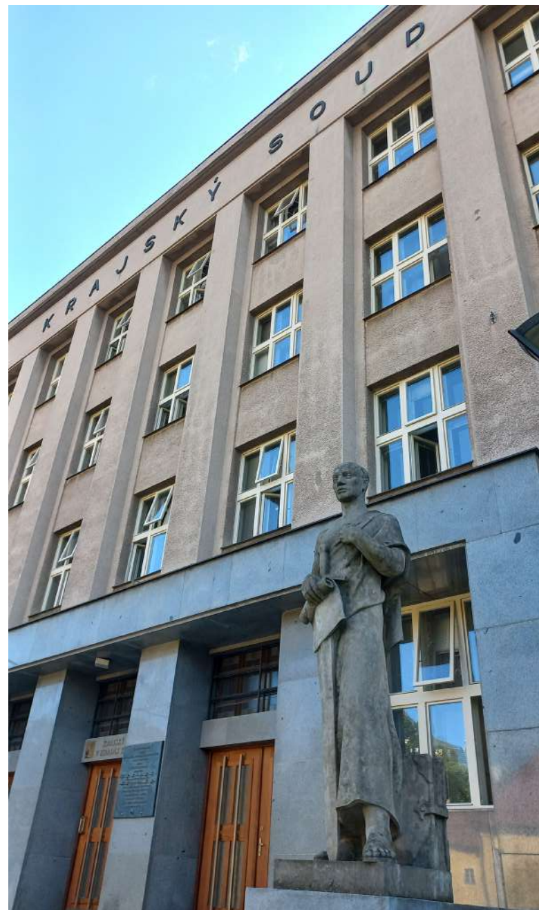
Krajský soud věc přenechal ke kárnému řízení [3]

U zbylých dvou dozorců pak bylo zahájeno řízení. V případě jednoho dozorce ředitelka rozhodla stejně jako o předchozích dozorcích a řízení zastavila. [6] V případě posledního dozorce řízení dále „ probíhá a bude ukončeno předáním rozhodnutí v nejbližší době “.