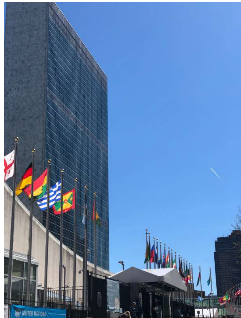
Generální sekretariát OSN, New York [1]

Dokument, na jehož podobě spolupracovaly NÚKIB, Ministerstvo zahraničních věcí a Ministerstvo obrany, se v kontextu kybernetické bezpečnosti vyjadřuje k základním otázkám mezinárodní-