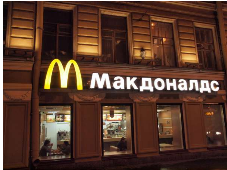
Například McDonald's se z Ruska v roce 2022 stáhl [3]

Například francouzská ropná společnost TotalEnergies ve Francii v nedávné době čelila dvěma žalobám dvou neziskových organizací, které ji obviňovaly z podílení se na válečných zločinech páchaných ruskou armádou. Tvrdily přitom, že palivo produkované TotalEnergies mělo být používáno ruskými válečnými letadly při ostřelování Ukraji-