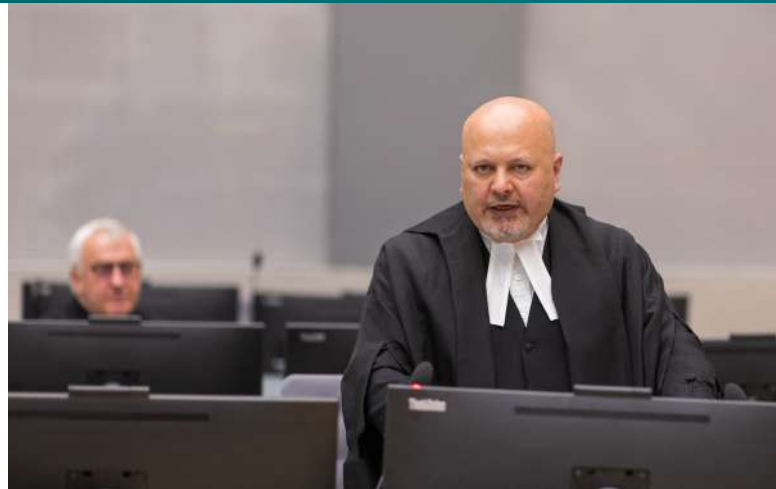
Prokurátor Karim Khan požádal přípravný senát o vydání zatykačů [1]

Zároveň byly podány žádosti o zatykače na izraelského premiéra Benjamina Netanjahua a ministra obrany Yoava Gallanta. Ti byli obviněni z válečných zločinů a zločinů proti lidskosti v Gaze, jmenovitě z cílených útoků na civilisty, spojené s hladověním, uvalením blokády a jinými násilnými činy proti palestinskému obyvatelstvu. Rozhodnutí podat žádost o všechny zatykače současně vyvolalo silné reakce