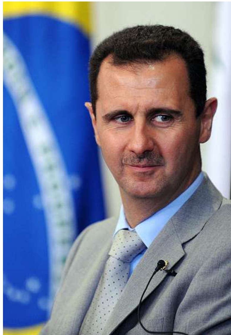
Syrský prezident Bašár al-Asad [2]

ICC. (2024, červen). Situation in Ukraine: ICC judges issue arrest warrants against Sergei Kuzhugetovich Shoigu and Valery Vasiljevich Gerasimov . Dostupné z: https://www.icc-cpi.int/news/situation-ukraine-icc-judges-issue-arrest-warrants-against-sergei-kuzhugetovich-shoigu-and