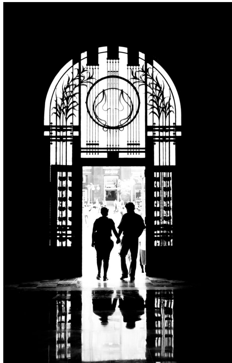
Stěžovatelka, které ÚS vyhověl, s podezřelým krátce tvořila pár [1]

Proti usnesení policejního orgánu podaly stěžovatelky stížnost, kterou Obvodní státní zastupitelství pro Prahu 3 (OSZ) zamítlo. „U žádných z poškozených