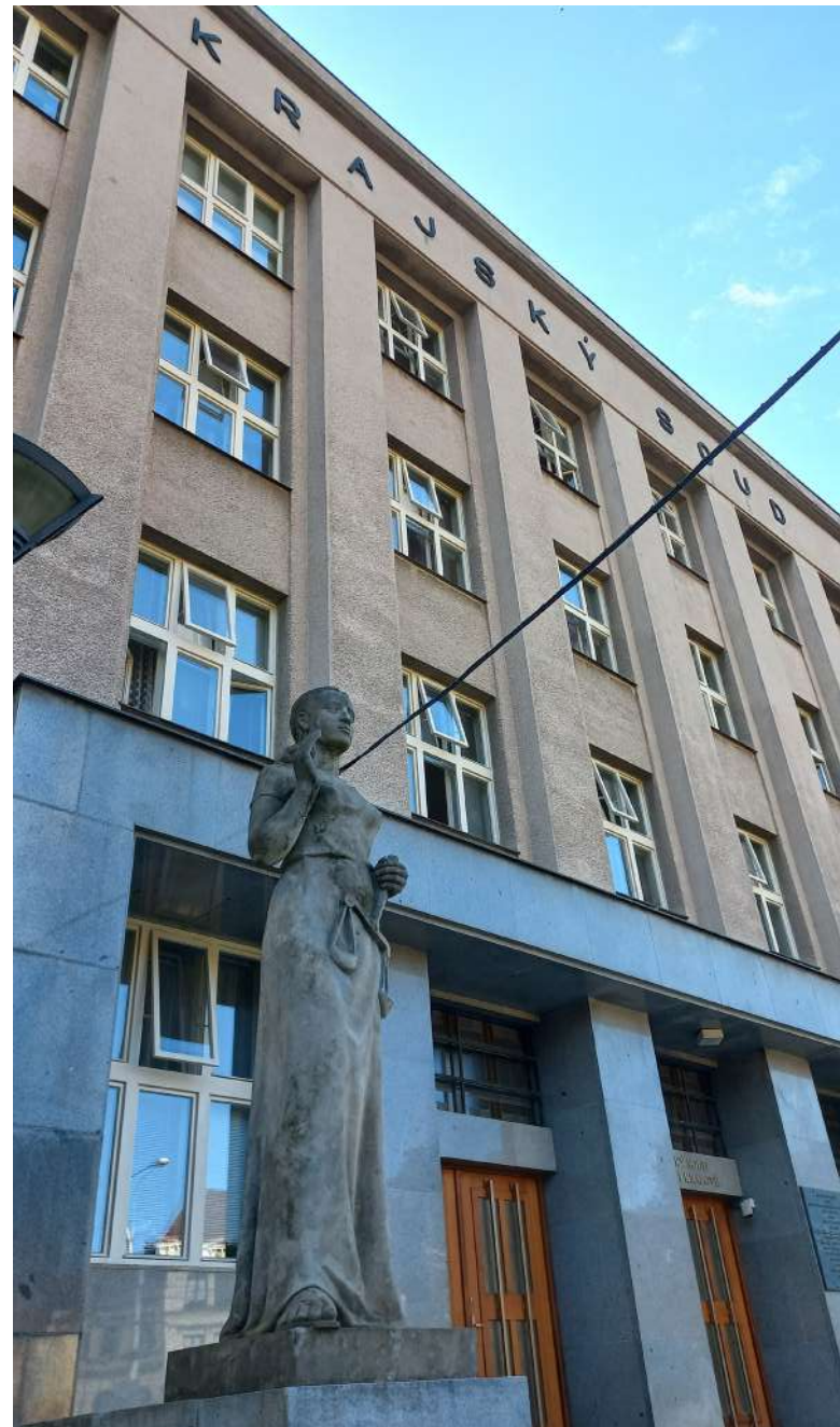
Krajský soud se s případem střetl již potřetí [1]

Dozorcí namítli, že okresní soud odmítl provést důkazy [2], které navrhli, čímž měl porušit jejich právo na spravedlivý proces. Rozporovali důvěryhodnost poškozené a poukázali na to, že soud dle nich špat-