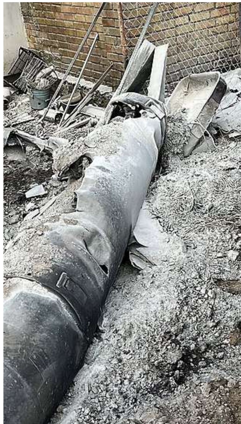
Raketa po útoku v kyjevské oblasti [1]

Tyto cílené útoky tak mají potenciál naplnit definici válečného zločinu, jelikož se přímo dotýkají