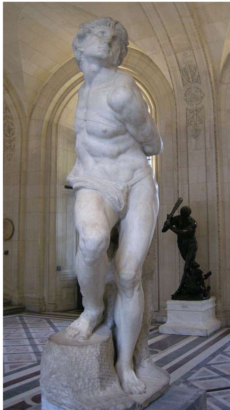
Metodika poutání dozná změn [4]

Zákon č. 555/1992 Sb., o Vězeňské a justiční stráži České republiky, ve znění pozdějších předpisů.