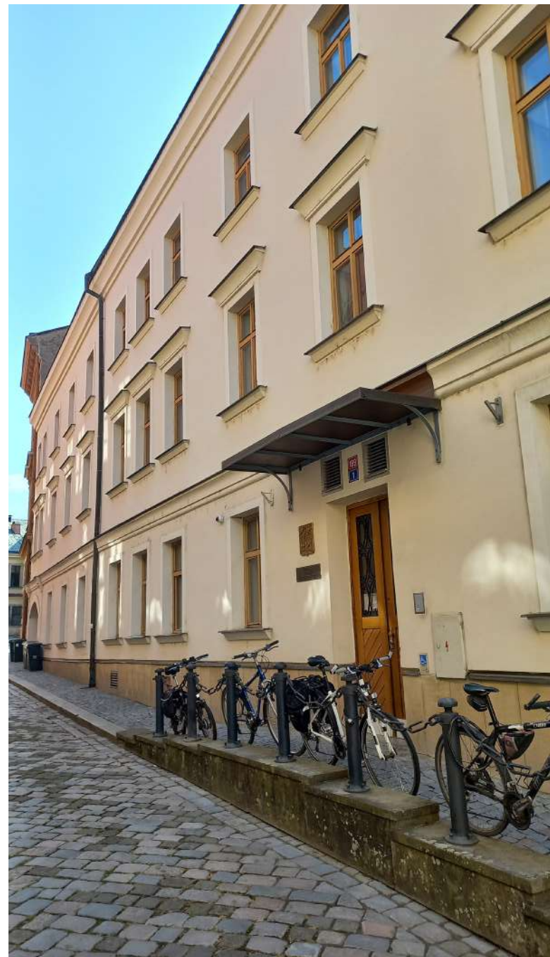
Budova Krajského státního zastupitelství v Hradci Králové [2]

Krajský soud opětovně provedl vybrané důkazy. Z podstatné části pracoval s kamerovými záznamy, přičemž na základě nich poukázal i na možné pochybnosti ohledně celkového počtu použití poutání poškozené. Rovněž zjistil, že poutání k pevnému předmětu bylo v rozhodné době ve věznicí nadužíváno. V rámci hodnocení výpovědi poškozené