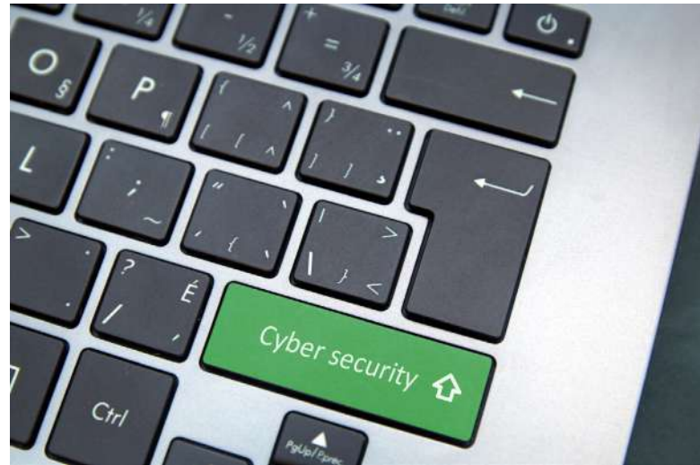
Cyber security [2]

[1] CCDCOE bylo založeno v roce 2008 s cílem podpořit členské státy NATO v oblasti výzkumu, školení a cvičení kybernetické obrany.