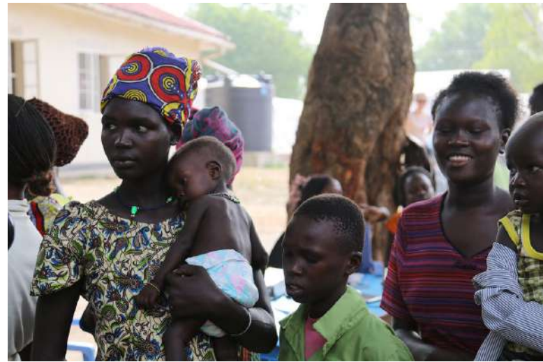
V Súdánu je v současnosti největší hladomor od roku 2017 [1]

V dubnu 2023 vypukla v Chartúmu, hlavním městě Súdánu, občanská válka mezi súdánskou armádou (SAF) a polovojskými Jednotkami rychlé podpory (RSF). Konflikt se pak z hlavního města rychle rozšířil i do zbytku země. Od začátku občanské