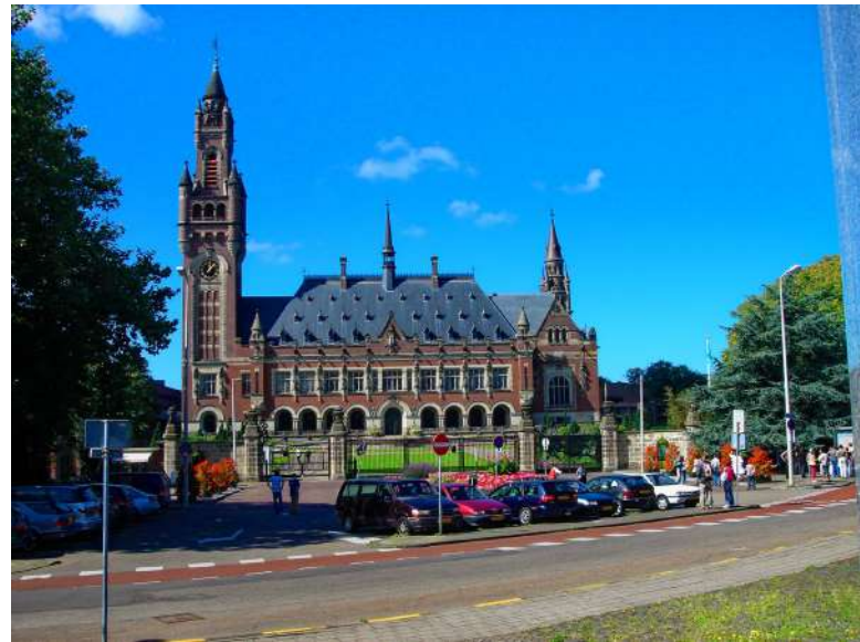
Mezinárodní soudní dvůr v Haagu [1]