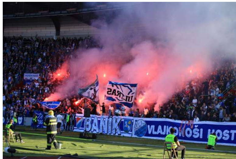
Primitivní rasismus je nadále doménou fotbalových hooligans a ultras [2]

Ruská federace v České republice podniká hybridní operace – ministr vnitra Rakušan tvrdí, že proti Česku Rusko průběžně podniká zejména kybernetické útoky. „Když k tomu připočtu, že policisté zadrželi Kolumbijce podezřelého ze zhářství na objednávku ruských bezpečnostních složek, je jasné, že Rusko proti nám útočí všemi možnými prostředky,“ dodává. S podezřením na sabotáže řízené z území Ruské federace