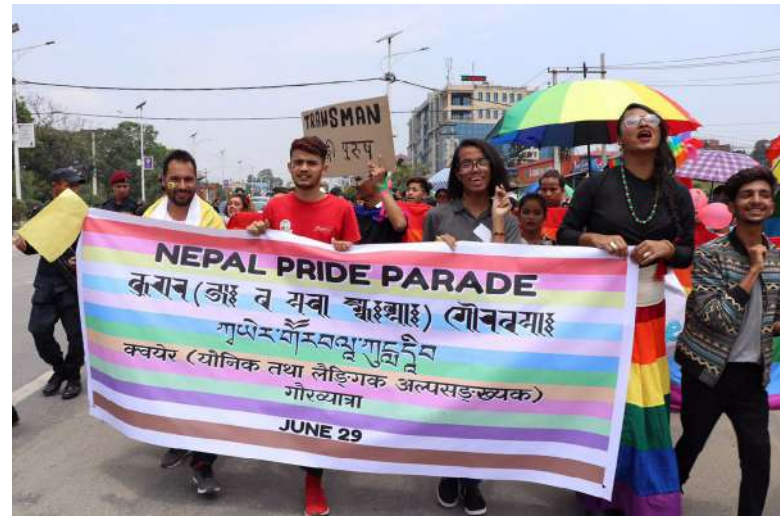
Nepal Pride Parade 2019 [3]

konečně ukončil diskriminaci a stigmatizaci, které jsem čelila všude, kam jsem přišla,“ řekla Kapali v rozhovoru s New York Times.