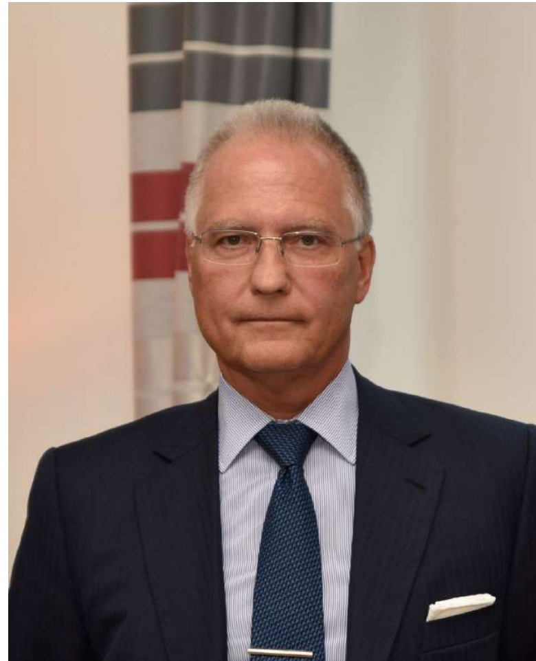
Ředitel Bezpečnostní informační služby Michal Koudelka [2]

ka. Ty se mohou stát terčem zájmu tamních zpravodajských služeb, které je mohou zkusit využít k aktivitám proti Česku.