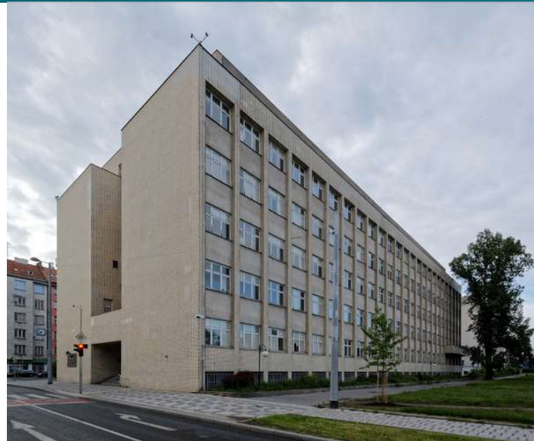
Ministerstvo vnitra vypracovalo pololetní zprávu o extremismu [1]

Skupina pravicových extremistů je vnitřně ideologicky nesoudržná. Kupříkladu ortodoxní neonacisté se drží obdivu německého Wehrmachtu a jednotek SS v boji proti Sovětskému svazu, zatímco někteří extremisté se však naopak přiklání k prokremelské propagandě a otevřeně podporují Ruskou federaci.