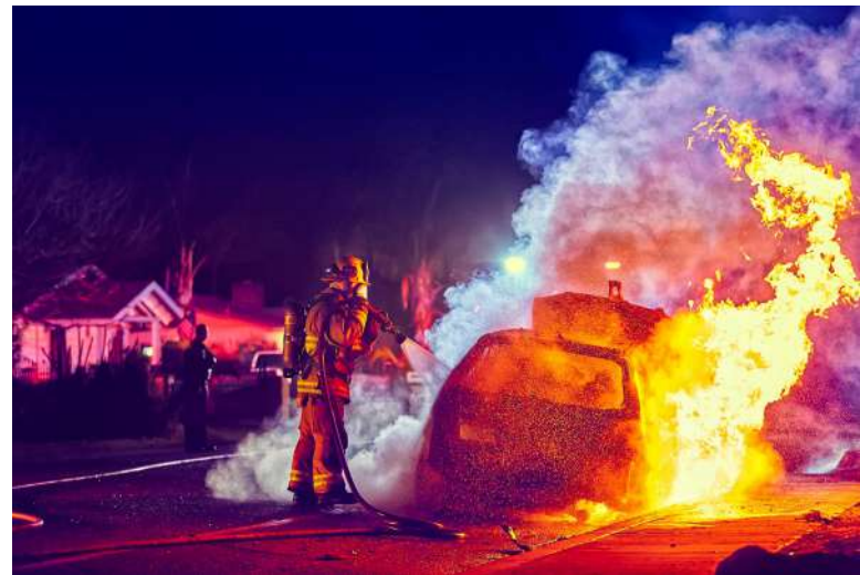
Kolumbijský žhář byl pravděpodobně financován Ruskem [3]

[1] Jde zejména o pseudoprávní tvrzení, že ČSFR zaniklo protiprávně, protože orgány veřejné moci postrádají jurisdikci.