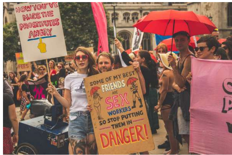
Sexuálně pracující v Británii prosazují dekriminalizaci prostituce [3]

ESLP uznal, že problematika prostituce vyvolává velmi citlivá morální a etická dilemata, na která mají členské státy Rady Evropy a mezinárodní organizace značně rozdílné názory. Dále konstatoval, že Francie má při regulaci dobrovolné prostituce široký prostor pro uvážení, jelikož v této oblasti neexistuje obecný konsensus. Zdůraznil, že zákon byl přijat demokratickým procesem, který odrážel