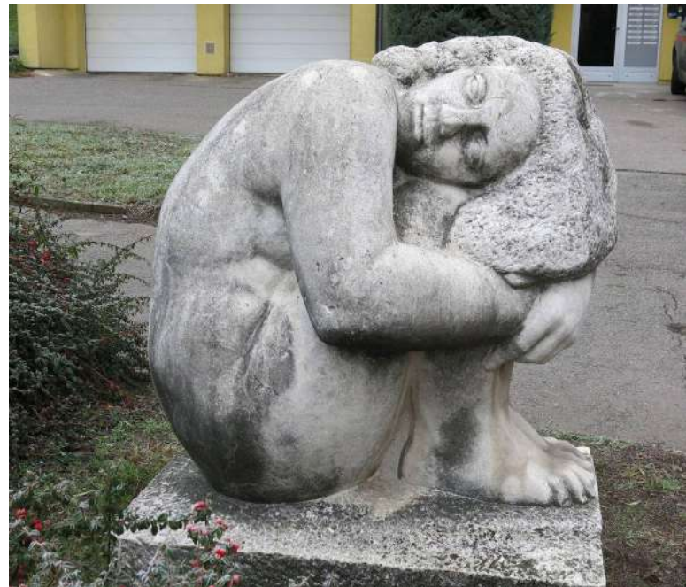
Sexuální násilí je nepřijatelné [2]

ÚS poukázal na povinnost státu zajistit „ efektivní systém procesních institutů sloužících ke kompenzaci újmy způsobené trestnou činností “. Krom soukromého zájmu poškozeného je dle ÚS skrze tuto povinnost chráněn i veřejný zájem na „ zjištění trestné činnosti a potrestání pachatele “. Zdůraznil, že trestní soudy mají posuzovat nárok poškozeného na náhradu újmy, pokud to zjištěný skutkový stav umožňuje posoudit. Uzavřel, že i skrze adhezní výrok lze zasáhnout do základních práv obětí trestných činů.