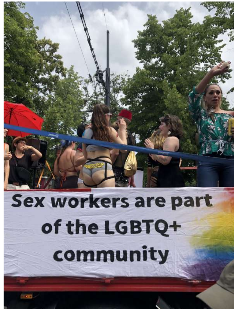
LGBT+ osoby v prostituci čelí vícenásobné diskriminaci [2]

Zákon však od svého přijetí vyvolává značné kontroverze. Zejména sexuálně pracující a organizace