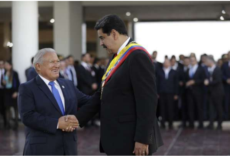
Nicolás Maduro [4]

skokem. V den voleb však získal Nicolás Maduro 51 % hlasů, zatímco Edmundo González Urrutia pouze 44 %.