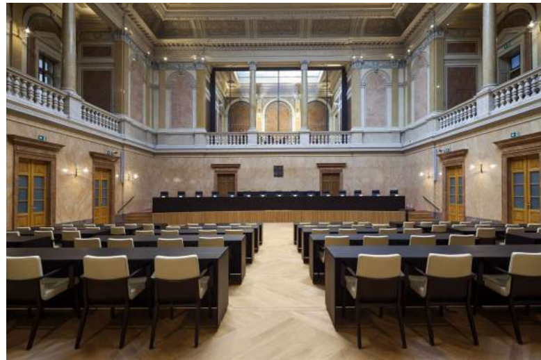
ÚS zasáhl ve věci vydání cizího občana [2]

V závěru ÚS uvedl, že věc vrací před vrchní soud, aby dal prostor stěžovateli uplatňovat i nadále své námitky. Vrchní soud bude muset nyní v novém řízení rozhodnout znovu o námitkách stěžovatele