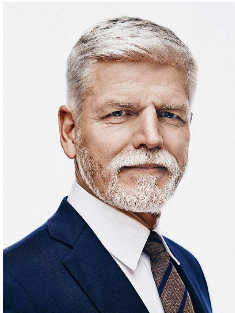
Prezident Petr Pavel uděloval milosti [2]