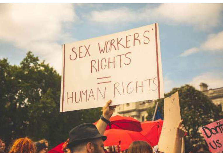
Kampaně po celém světě se snaží o destigmatizaci sexuální práce [1]

V roce 2019 podala skupina 261 žen a mužů různé národnosti, kteří se ve Francii legálně věnují prostituci, stížnost k Evropskému soudu pro lidská práva (dále ESLP) proti rozhodnutím francouzských sou-