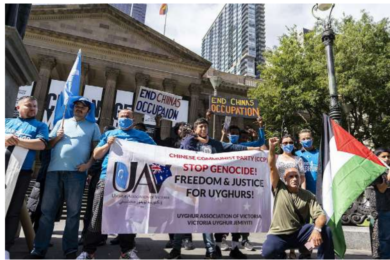
Dočkají se Ujgurové konečně spravedlnosti [3]

Uyghur Human Rights Project (červenec 2024). Landmark Decision as Argentina Court of Cassation Reverses Judge's Decision Not to Open Uyghur Case for Crimes Against Humanity and Genocide . Získáno z: https://uhrp.org/statement/landmark-decision-as-argentina-court-of-cassation-reverses-judges-decision-not-to-open-uyghur-case-for-crimes-against-humanity-and-genocide/