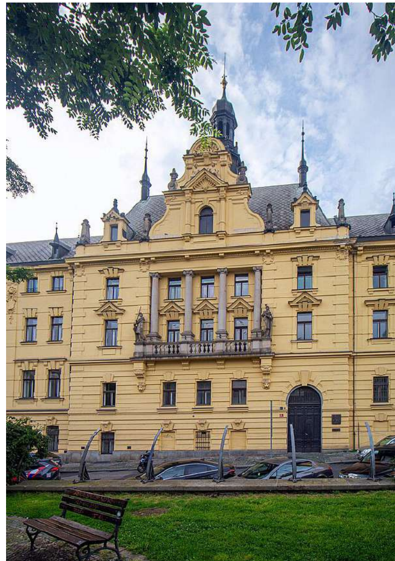
Městský soud nepředložil doplněnou stížnost [1]

Městský soud v Praze (městský soud) následně rozhodl [2], že vydání stěžovatele do Tuniska je přípustné. V odůvodnění argumentoval především tím, že stěžovatel nebude při výkonu trestu podroben krutému, nelidskému či ponižujícímu zacházení. Městský soud zároveň požádal tuniskou stranu o doplnění diplomatických záruk vzhledem