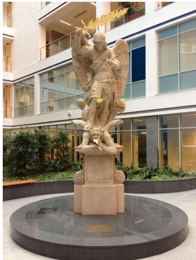
Městský soud v Brně pochybil [1]

Okresní soud v Blansku (nalézací soud) nejprve uznal pachatele vinným ze zločinu pohlavního zneužití dívky a přečinu ohrožování její výchovy. Dívka v trestním řízení uplatnila nárok na náhradu nemajetkové újmy. Nalézací soud ji však s tímto nárokem odkázal na civilní soudní řízení. Své rozhodnutí odůvodnil tím, že dívka dle něj nepředložila „žádné listinné důkazy v podobě zpráv odborných lékařů či psychologů“, aby prokázala míru narušení jejího přirozeného psychického a sexuálního vývoje.